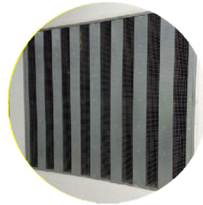
Test LAIC 8-201/06 L'atténuation due à la profondeur (P) et de la fréquence de bruit (Hz)